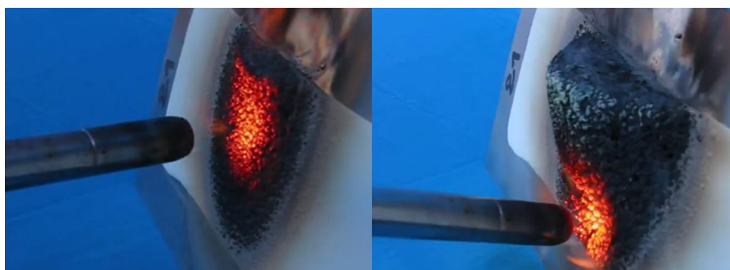
Figure 1 : Effet intumescent du gelcoat Nuvopol 37-05.

La maîtrise de diverses technologies d'ignifugation, que ce soit par intumescence (Figure 1) ou par ignifugation en masse des produits (résines formulées), permet à la société MÄDER de proposer des solutions efficaces et adaptées.