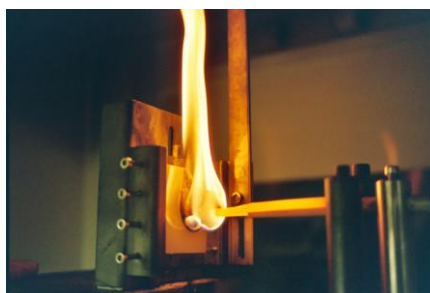
Photographie 1 : Exemple d'essai normalisé – CEI IC 60695-2-10 (Essais au fil incandescent).